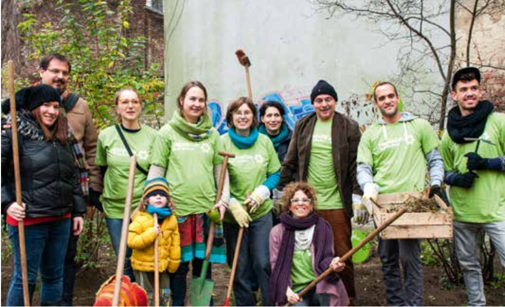
Mitzvah-Aktion von Jews Go Green in Berlin