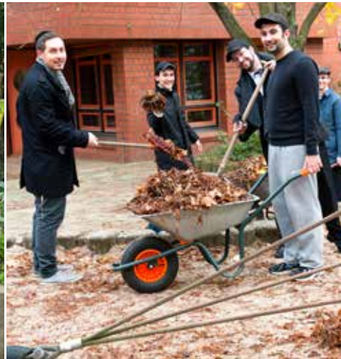
Studenten des Hildesheimer Rabbinerseminars und des Yeshivas Beis Zion in Berlin-Wedding und im SOS Kinderdorf.

41 % der Projektkoordinatoren stimmen der Aussage zu, dass der Mitzvah Day ihnen das Gefühl gegeben habe, „wirklich etwas bewirken zu können.“