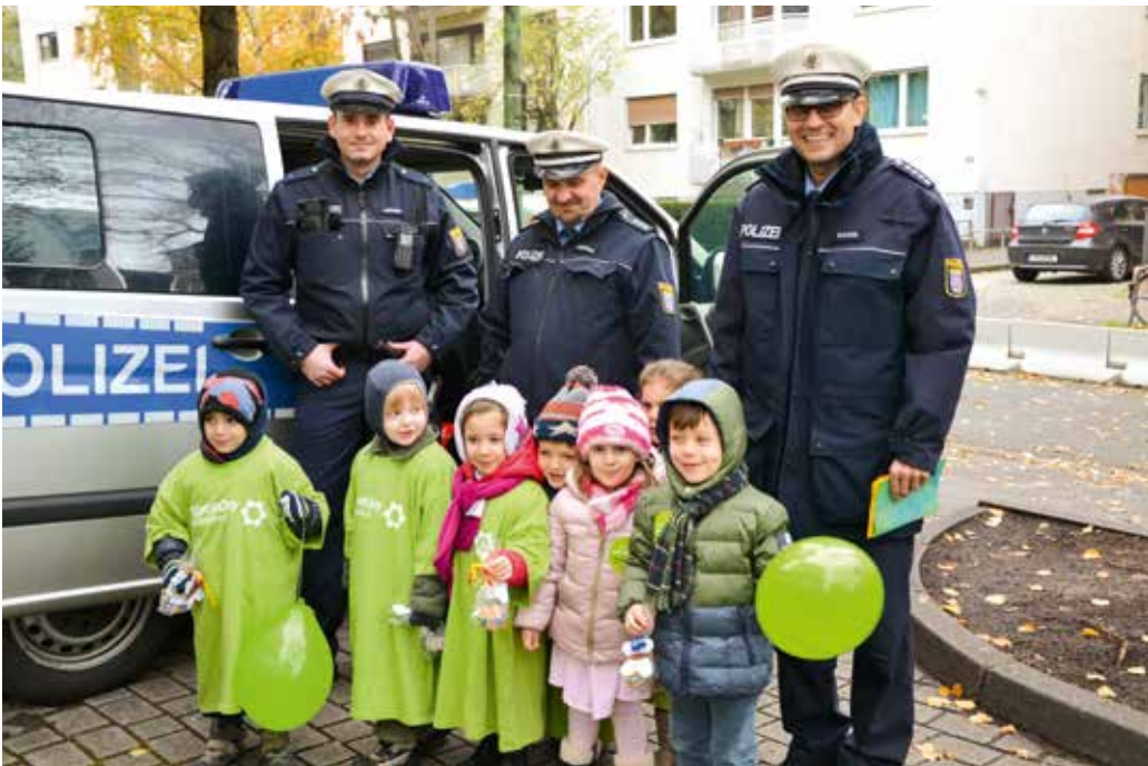
Mitzvah Day in Frankfurt/M.