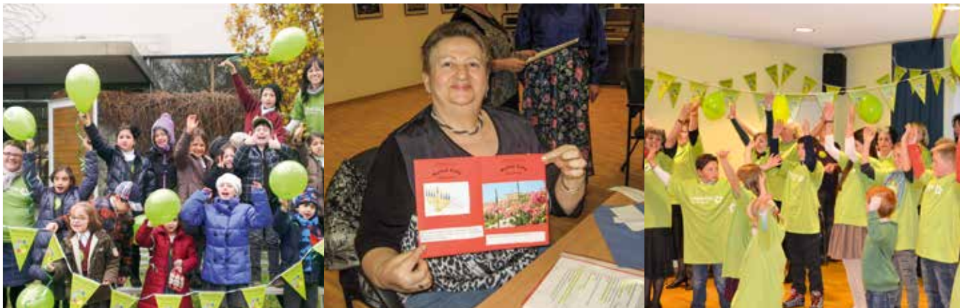
Mitzvah Day in Berlin, Köln und Lörrach

Der Mitzvah Day ist ein Beispiel dafür, dass wirklich Jeder unsere Welt ein Stück besser machen kann. Unabhängig von der Höhe des Einkommens und auch unabhängig vom Alter.