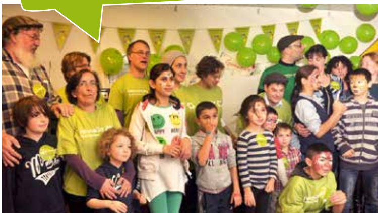
Große Mitzvah Day Aktion im Berliner Asylbewerberheim Hellersdorf

als 35.000 Teilnehmer aus 457 Gemeinden zusammengebracht. Der jüdische Aktionstag gibt weltweit Impulse für mehr Gemeinschaft und soziales Engagement. Diese Länder waren 2013 dabei: Australien, Belgien, Brasilien, Frankreich, Deutschland, Griechenland, Großbritannien, Irland, Israel, Österreich, Polen, Portugal, Slowakei, Südafrika, Spanien, Türkei, Ukraine, USA, Simbabwe.