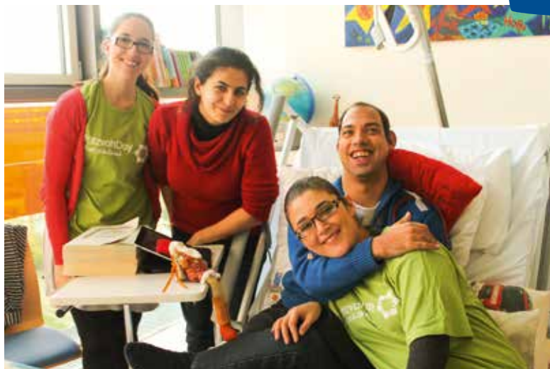
Hillel Heidelberg Hub und Muslimische Studierenden- gruppe der Uni Heidelberg

54 % glauben, dass ihr Mitzvah Day Projekt dazu führt, dass die Teilnehmer längerfristig aktiv werden. 38,5 % halten es immerhin für möglich.