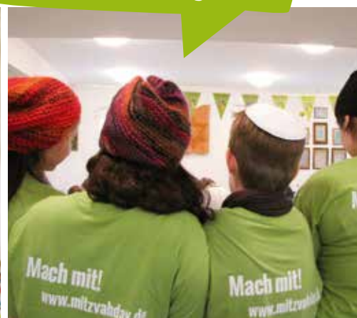
Mitzvah Day in Frankfurt, Pforzheim, Emmendingen